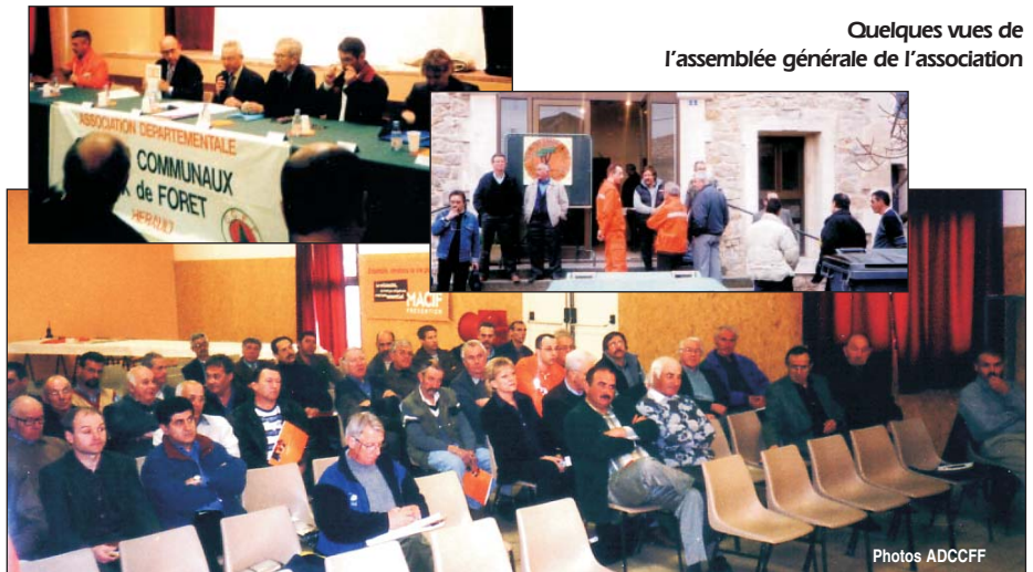
Quelques vues de l'assemblée générale de l'association

Pour en savoir plus, rendez vous sur le site internet www.cc-feuxforets.org