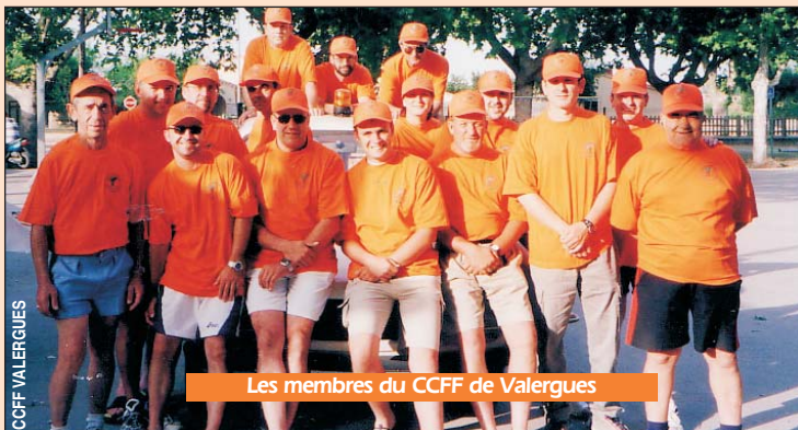
Les membres du CCFF de Valergues

Hérault, que dans la région PACA, les Conseils Généraux et le Conseil Régional participent de manière importante à l'équipement de tous les Comités Communaux Feux de Forêts.