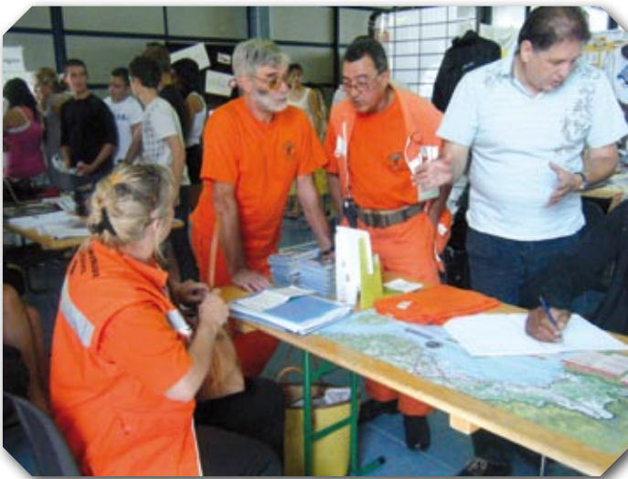
Forum des associations à St Georges d'Orques

Ce CCFF, composé de 25 bénévoles a tout pour bien commencer la saison 2009.