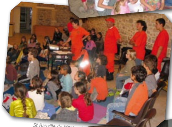
St Bauzille de Montmel