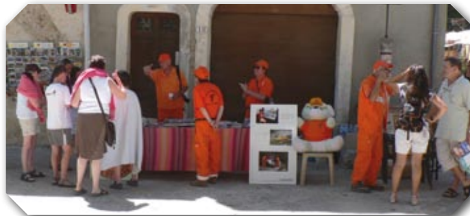
St Guilhem le Désert