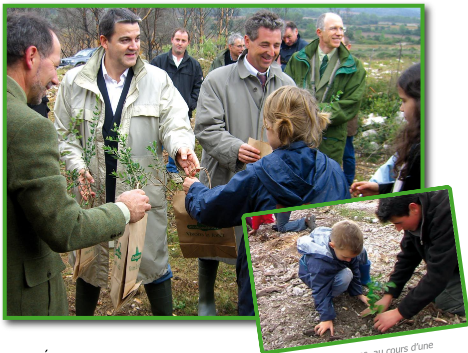
Les enfants de Galargues, au cours d'une cérémonie, ont planté des arbres.

Ces derniers ont reçu à la fin de la séance, une documentation rappelant les consignes de prévention pour la protection de nos garrigues et forêts.