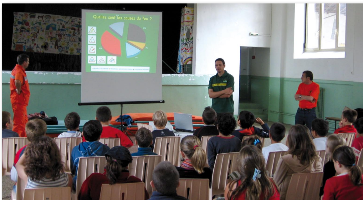
Les enfants des écoles de 13 communes de l'Hérault ont suivi une information par diaporama des dangers et des conduites à tenir pour conserver notre environnement.

* Assas, Clapiers, Combaillaux, Galargues / Buzignargues, Le Pouget, Montferrier sur Lez, Prades le Lez, Saint Clément de Rivière, Saint Geniès des Mourgues, Valergues, Vendargues, Villetelle.