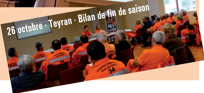
26 octobre - Teyran - Bilan de fin de saison