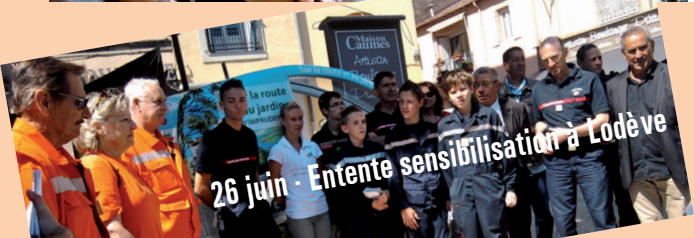
26 juin - Entente sensibilisation à Lodève