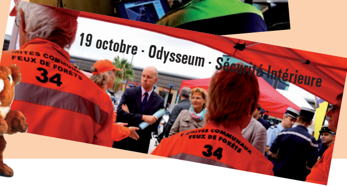
19 octobre - Odysseum - Sécurité Intérieure