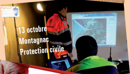
13 octobre Montagnac Protection civile