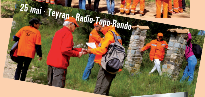
25 mai - Teyran - Radio-Topo-Rando