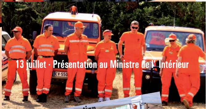
13 juillet - Présentation au Ministre de l'Intérieur