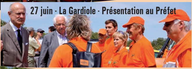
27 juin - La Gardiole - Présentation au Préfet