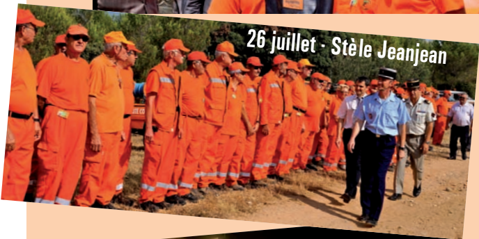
26 juillet - Stèle Jeanjean