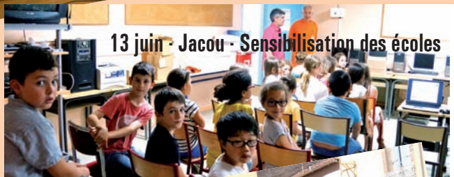
13 juin - Jacou - Sensibilisation des écoles