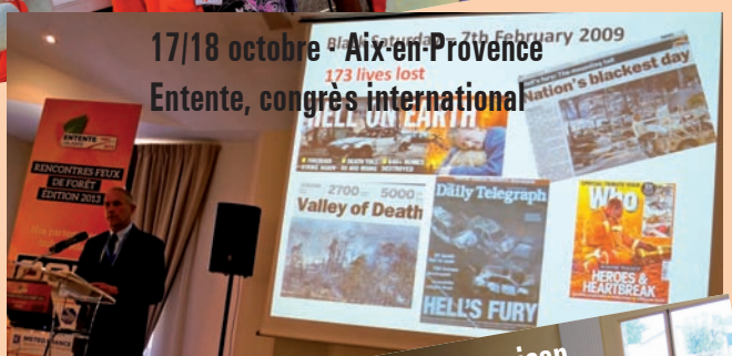
17/18 octobre Aix-en-Provence Entente, congrès international