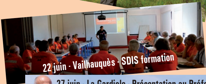
22 juin - Vailhauquès - SDIS formation