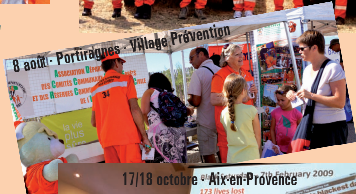
8 août - Portiragnes - Village Prévention