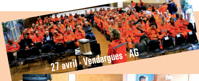
27 avril - Vendargues - AG